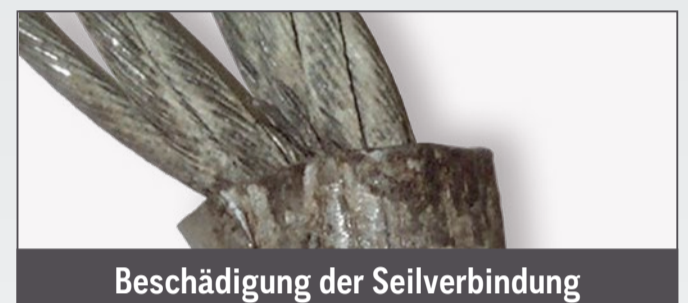
Beschädigung der Seilverbindung