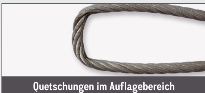
Quetschungen im Auflagebereich