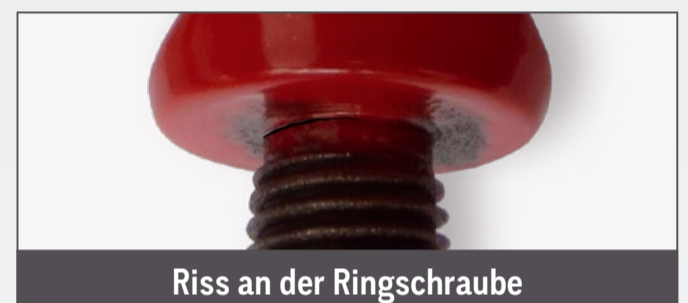
Riss an der Ringschraube