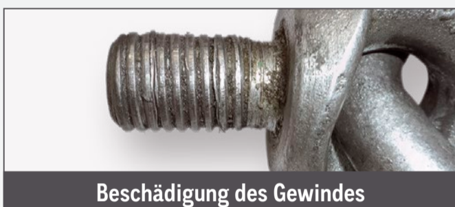
Beschädigung des Gewindes