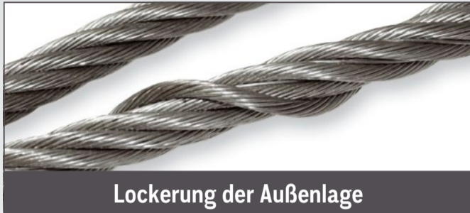
Lockerung der Außenlage

Vor der Überprüfung ist der Lifty verseilt zu reinigen. Es sind folgende Kriterien zu beachten: